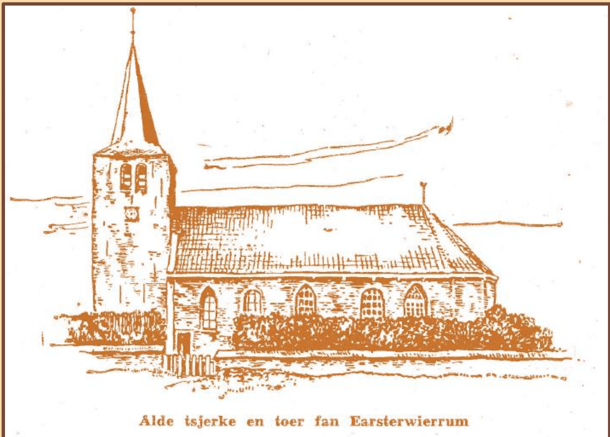
Alde tsjerke en toer fan Earsterwierrum