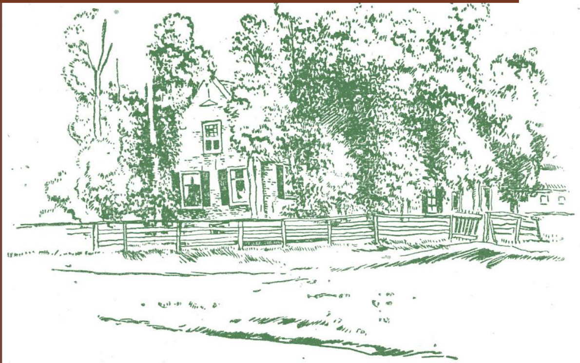
De âld pleats fan Tsjomme Hajes