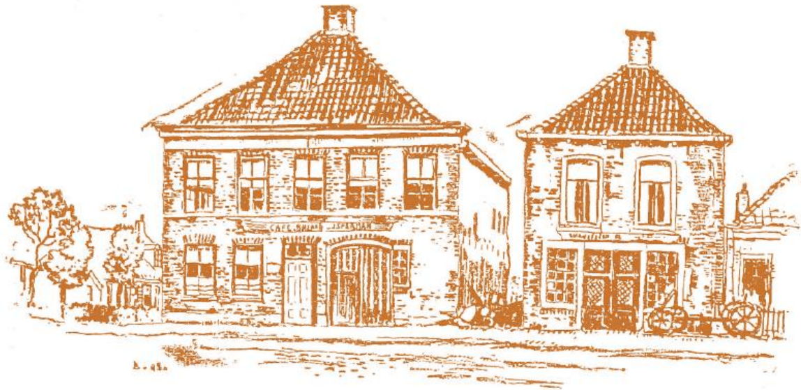
De wite herberch.