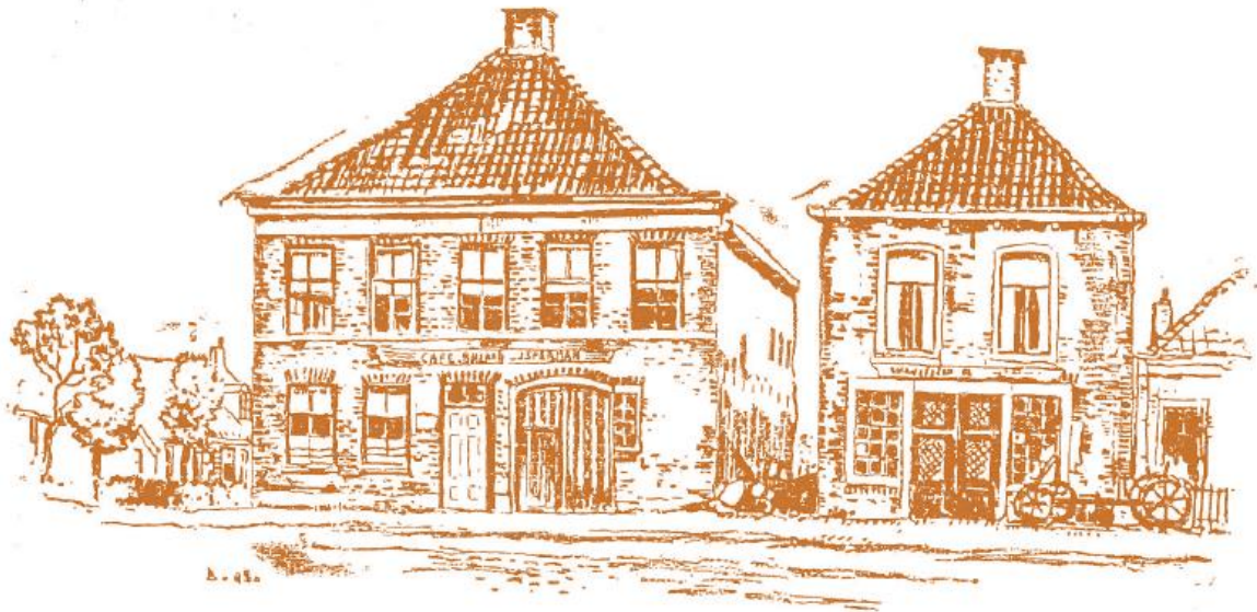
De wite herberch.