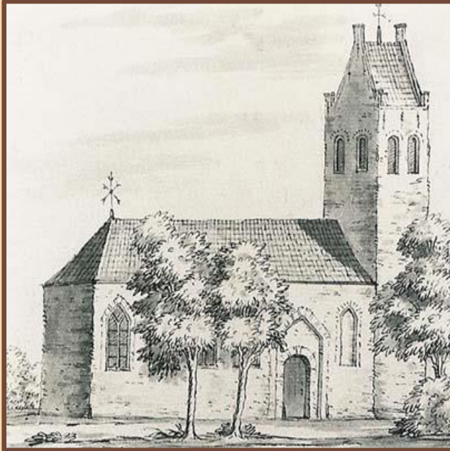
[pentekening van het NH kerkje te Oostwierum]